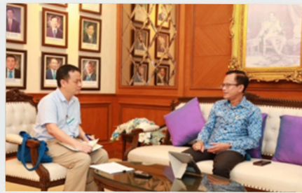
สำรวจความพึงพอใจและรับฟังความคิดเห็นของผู้มีส่วนได้ส่วนเสียที่มีต่อ กปภ.