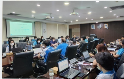
อบรมหลักสูตรการสร้างสัมพันธ์กับผู้มีส่วนได้ส่วนเสียอย่างบูรณาการ

สร้างความรู้ด้านการบริหารจัดการและสร้างความสัมพันธ์ผู้มีส่วนได้ส่วนเสียแก่บุคลากร