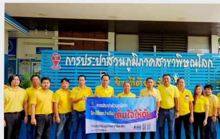
โครงการมุ่งมั่นเพื่อประชาชนเต็มใจให้กัน

แผนการสร้างสัมพันธ์กับผู้มีส่วนได้ส่วนเสียของฝ่าย/เขต