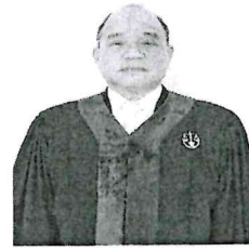
นายอาทร คุระวรรณ อธิบดีศาลปกครองสงขลา