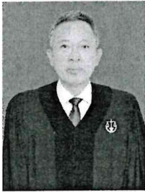
นายเกียรติภูมิ แสงศศิธร อธิบดีศาลปกครองนครราชสีมา